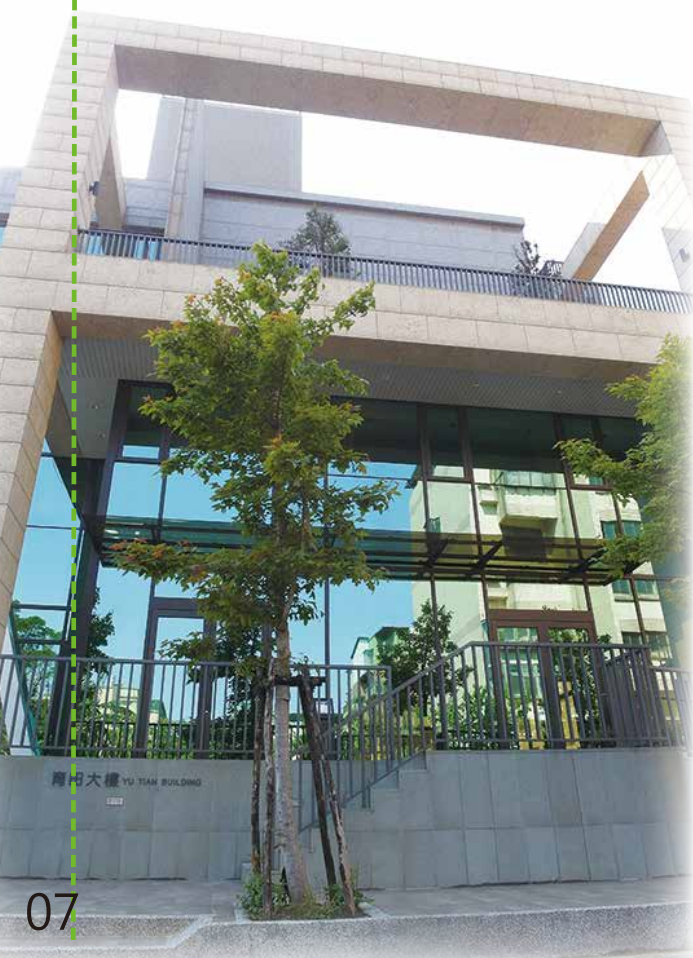
育田大樓 YU TIEN BUILDING