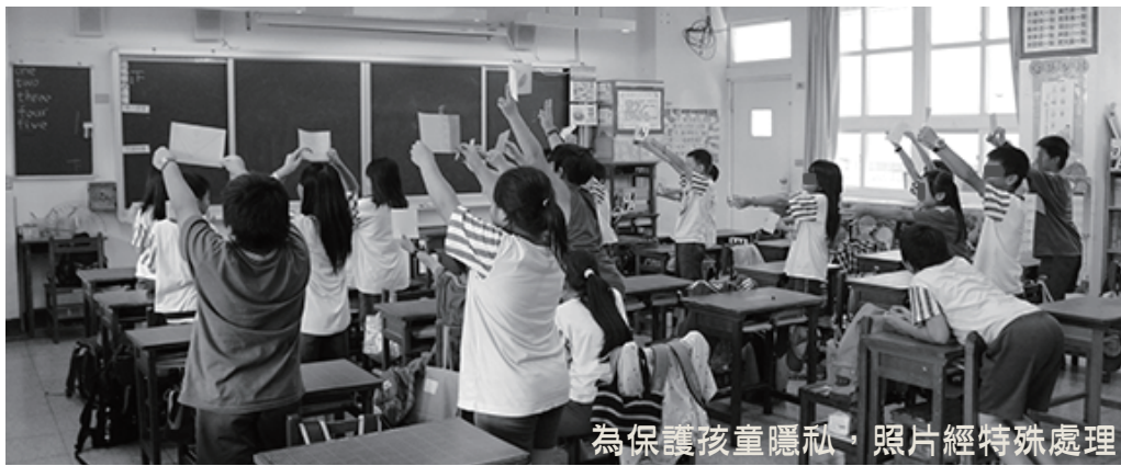
為保護孩童隱私，照片經特殊處理