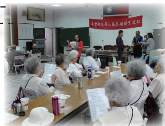
大榮一村關懷據點