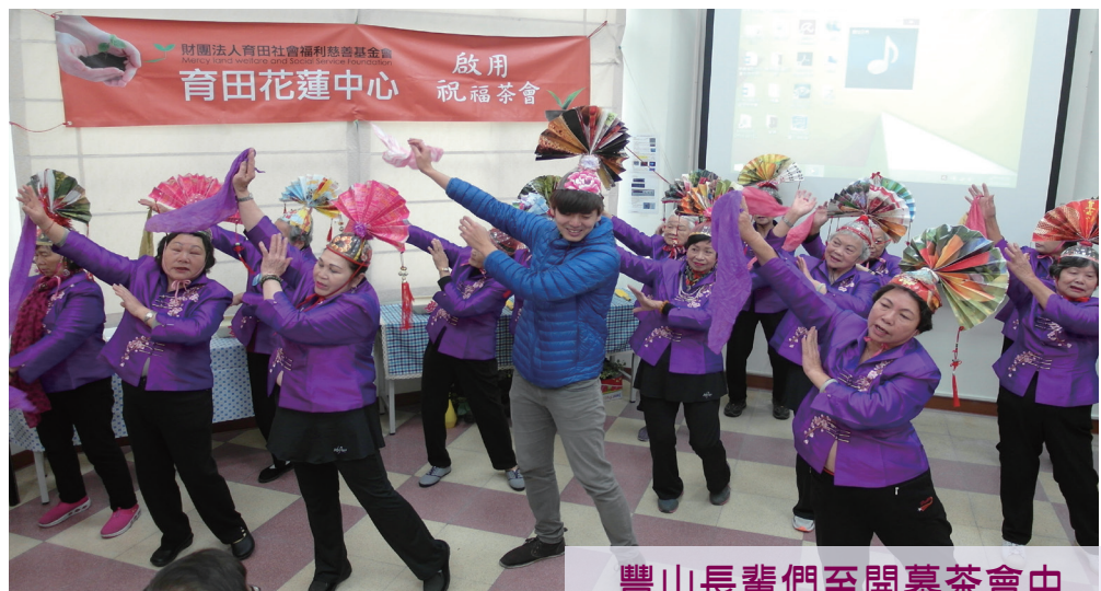
豐山長輩們至開幕茶會中 獻上「煙花三月」的舞蹈