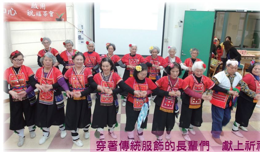
穿著傳統服飾的長輩們 獻上祈福舞蹈

雖然放眼望及都是女性長輩們，但也還是能發現男性的蹤影。一開始也許會在舞蹈動作中感到害臊，但隨著練習的時間增長，以及對夥伴的熟識，他們現在總是一體熱情展現舞姿。