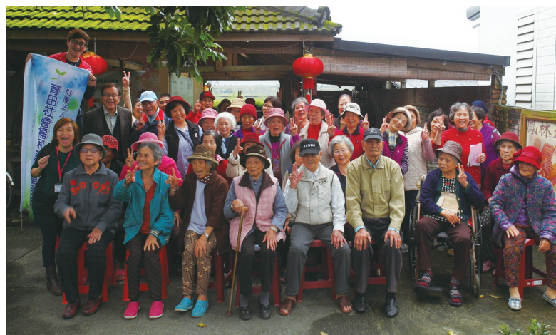
育田想要守護長者的每一個笑容

育田看見社區據點的困處，我們提供長達一年的補助，每月提供據點固定的補助款項，讓志工們能運用於長者的伙食、活動的支出，亦或是補助志工們訪視的開銷等。