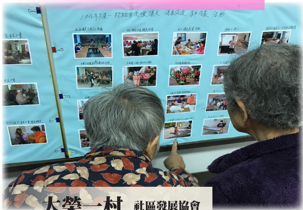
大榮一村 社區發展協會

在今日，想到鄉村， 可能直覺想到的是廣闊的田野、零星的聚落、年邁的長者。 同樣在花蓮鳳林地區也面臨人口流失、人口老化的問題。